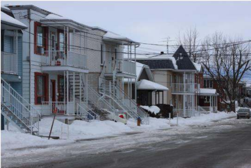
La demande dépasse largement l'offre de logements abordables dans la région.