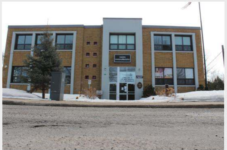
Le Centre communautaire de Louiseville a aussi été lourdement endommagé par un incendie criminel survenu le 31 mars 2019.