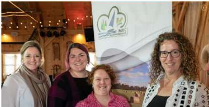
Forum en habitation et logement de la MRC de Maskinongé